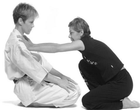
Abb. 5 Instabiler Sitz