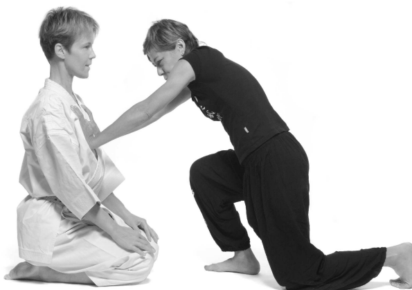
Abb. 6 Stabiler Sitz